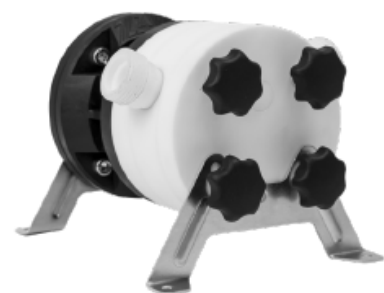
ACOSTAR ohne Antrieb